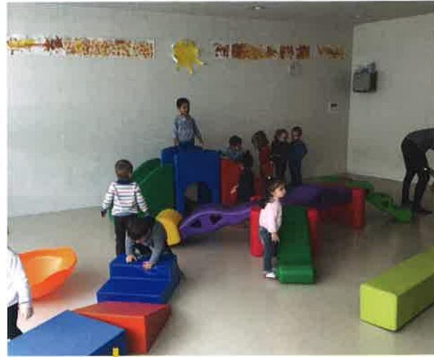
Séance de motricité pour les tout-petits