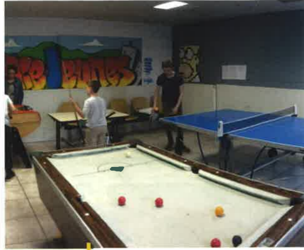
Moment de détente à l'Espace jeunes