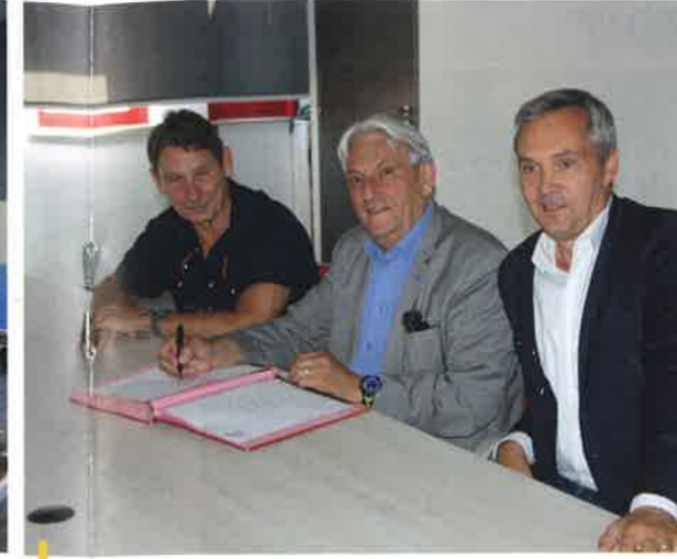
Signature des DSP avec les délégataires : la SLEA et l'IFAC

LE RENOUVELLEMENT DES DEUX DÉLÉGATIONS DE SERVICES PUBLICS EN CHARGE DE LA PETITE ENFANCE, DE L'ENFANCE ET DE LA JEUNESSE SUR LA COMMUNE SERA EFFECTIF AU 1 ER SEPTEMBRE 2017. LA SIGNATURE DES CONTRATS A EU LIEU LE 4 JUILLET DERNIER EN MAIRIE, EN PRÉSENCE DES DEUX DÉLÉGATAIRES RETENUS.