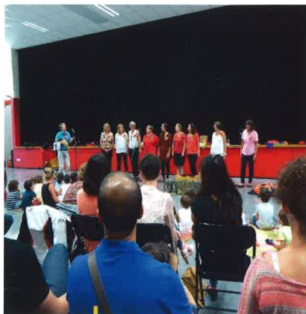
Spectacle musical des assistantes maternelles du RAM « les coccinelles »