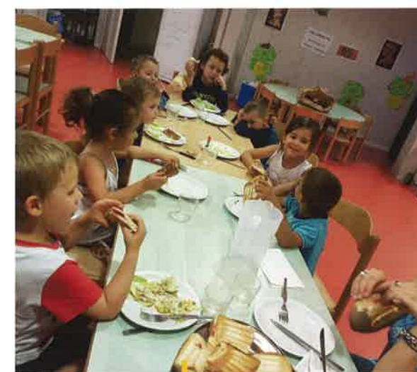
Dégustation après un atelier cuisine à l'accueil de loisirs

A partir de 17 ans, les jeunes peuvent également se rendre au Point Information Jeunesse (PIJ) pour toute question relative à l'orientation, les jobs d'été, les séjours à l'étranger, etc. Une informatrice-jeunesse les accueille anonymement et gratuitement.